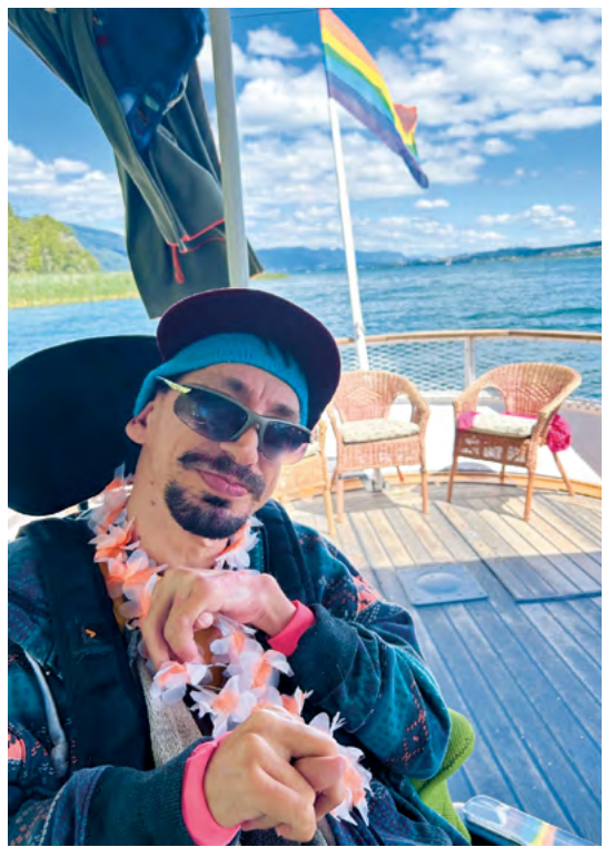
Bunte Welt an der 80er-Jahre-Party auf der MS Jura.