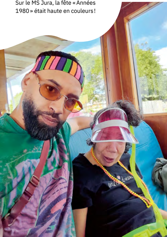
Sur le MS Jura, la fête « Années 1980 » était haute en couleurs!